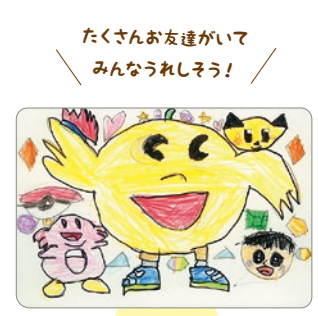
たくさんお友達がいて みんなうれしそう！