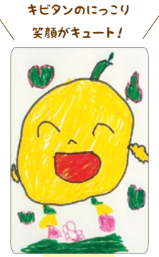
キビタンのにっこり 笑顔がキュート！