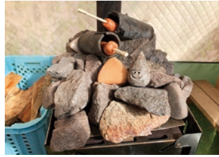
完全貸切のテント内では電話注文でサウナ飯も楽しめます

猪苗代湖の砂浜に設置してあるテントで「フィンランド式サウナ」を楽しめます。後ろには磐梯山がそびえたっており、大自然を満喫しつつ水風呂の代わりに猪苗代湖に入ったり、外気浴をしたりと完璧に「ととのう」ことができます。