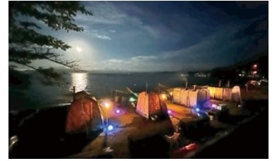
耶麻郡猪苗代町翁沢長浜 870 圏レイクサイドホテルみなとや ☎0242(65)2111