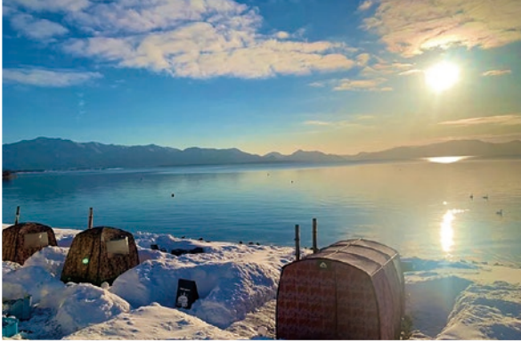
冬には白鳥が飛来する猪苗代湖。幻想的な空間でリフレッシュできます