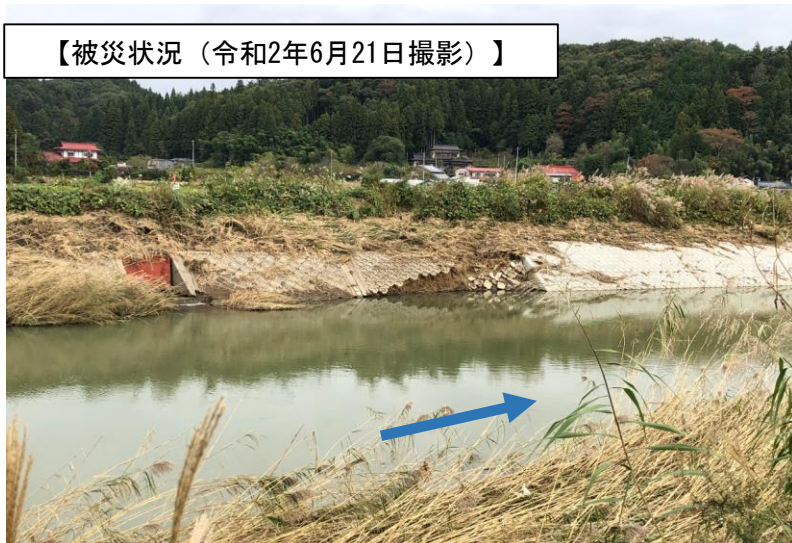
【被災状況（令和2年6月21日撮影）】