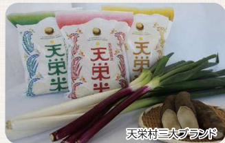
天栄村三次ブランド