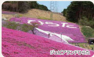
ジュピアランドひらた