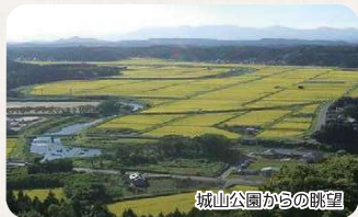
城山公園からの眺望