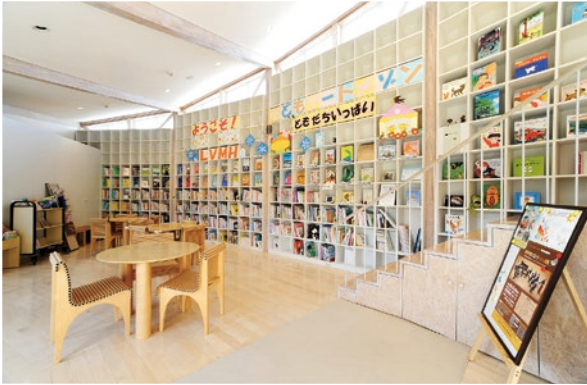
絵本をはじめ約 2500 冊もの本がずらりと並びます。天井付近のガラス戸から光が入り、開放感がある空間です