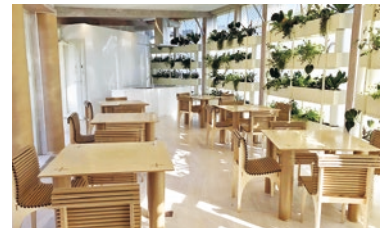
相馬市中村二丁目 2-15 ☎0244(26)7415 定休日/年末年始(12月29日~1月3日) 営業時間/午前9時~午後6時