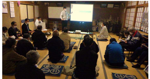
【写真②】 長野地区の事業説明会状況 (R4.11.10)

工事箇所周辺の皆様にはご不便をおかけしておりますが、引き続き、本事業へのご理解、ご協力をお願い致します。