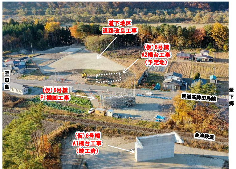
【写真①】 長野地区の工事状況 (R4.11.7)