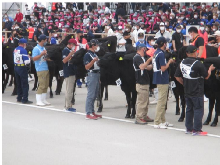
第3区（若雌の2） 審査風景