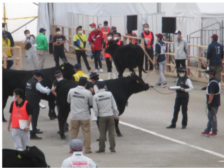
第2区（若雌の1） 審査風景