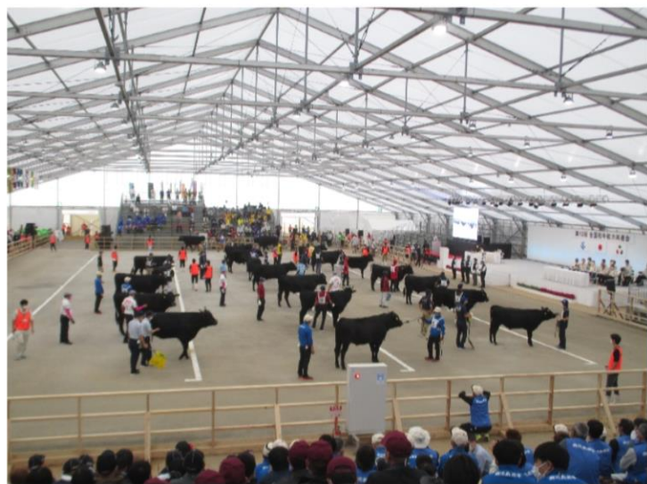
第1区（若雄） 審査風景