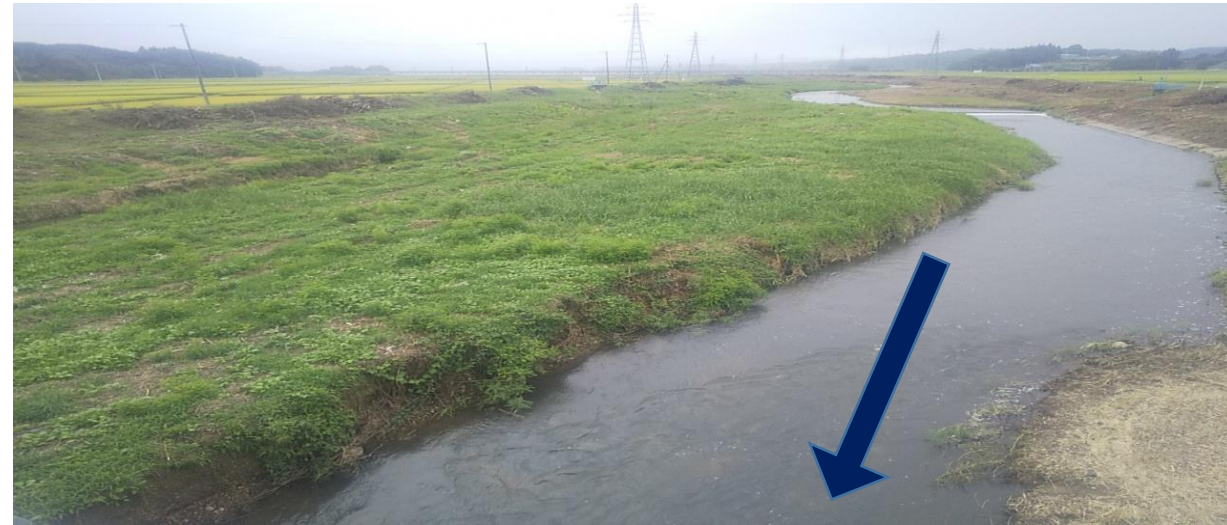
布川橋上流（施工後）