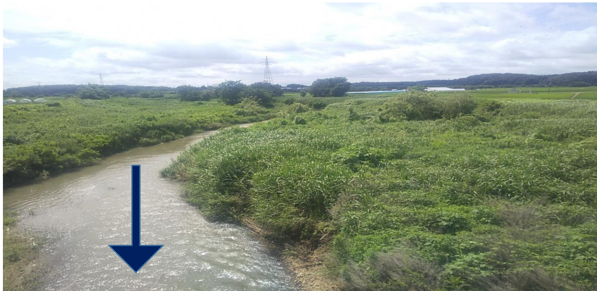
布川橋下流（施工前）