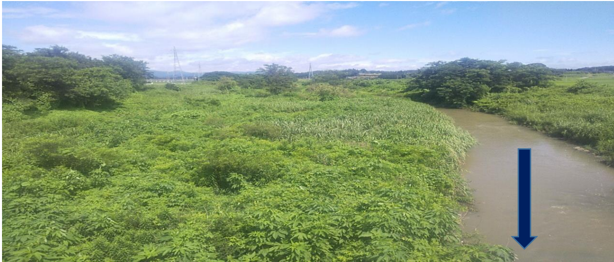
布川橋上流（施工前）