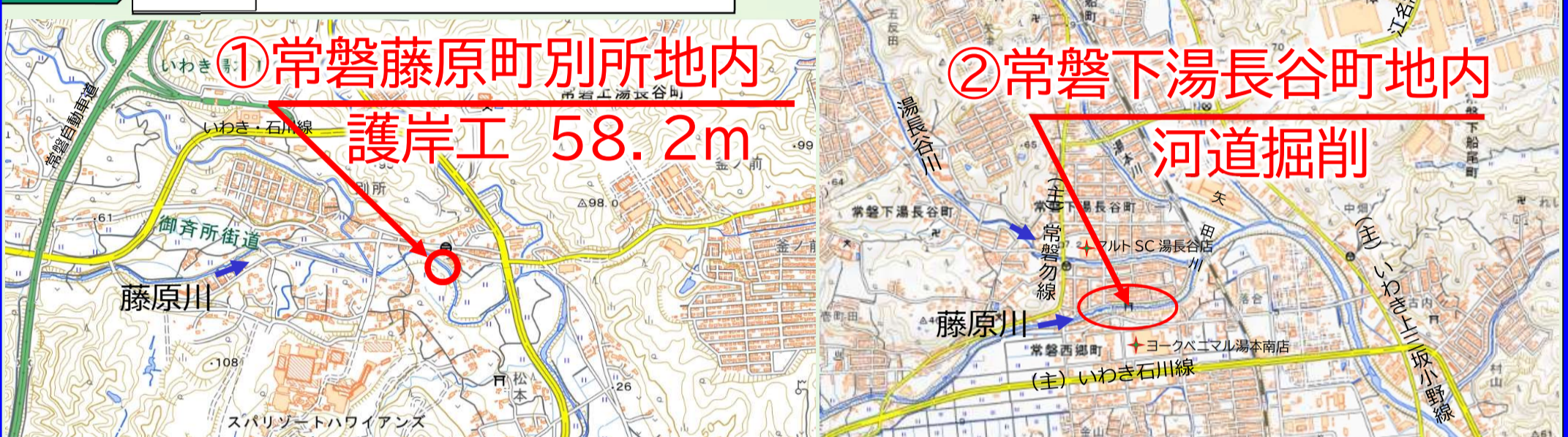
写真 藤原川で実施している工事の代表的な箇所を掲載しています。