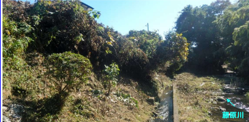
①藤原川 常磐藤原町別所地内 【施工前】