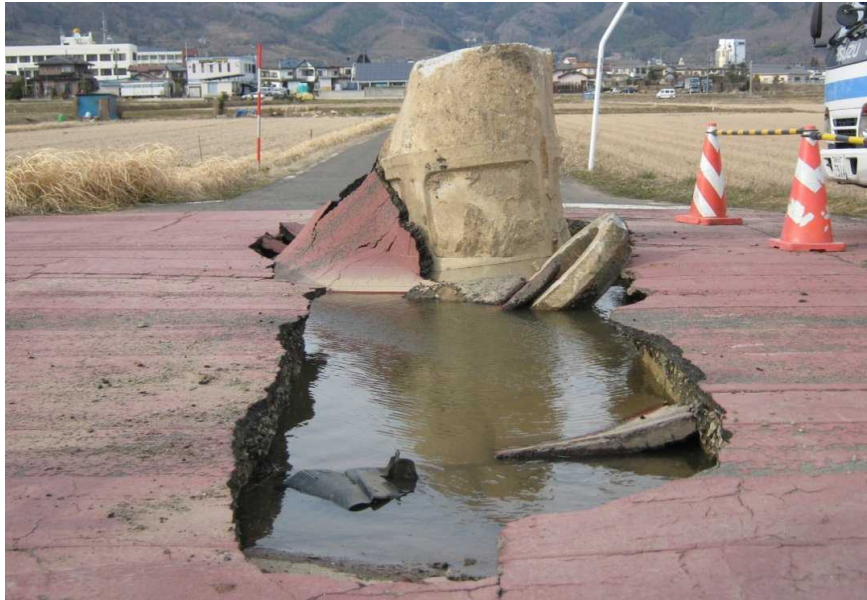
写真1-1 国見幹線(地内) 液状化によるマンホールの浮上