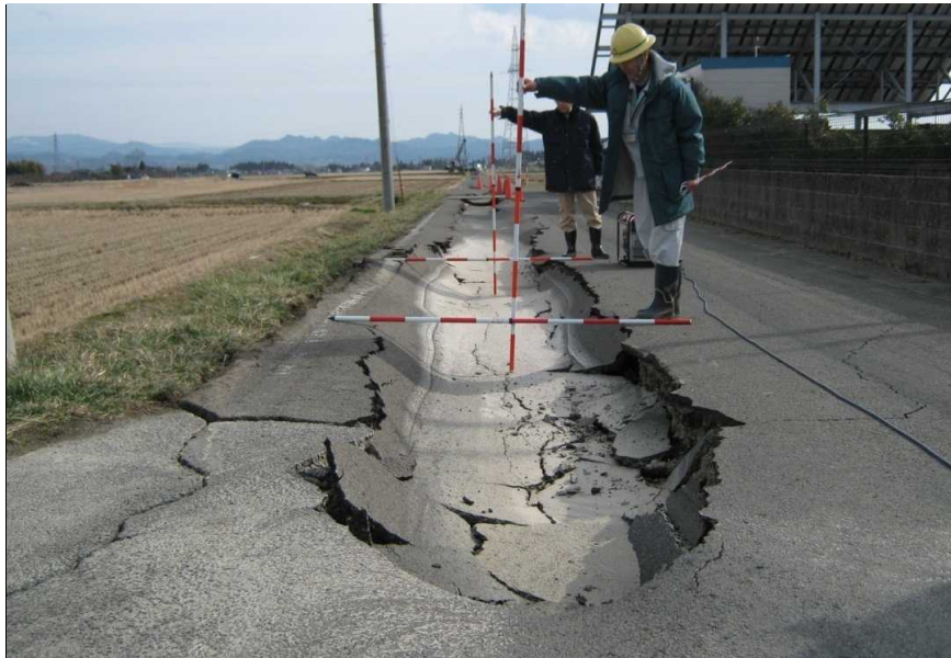
写真2-1 国見幹線(地内) 管路損傷に伴う道路の陥没