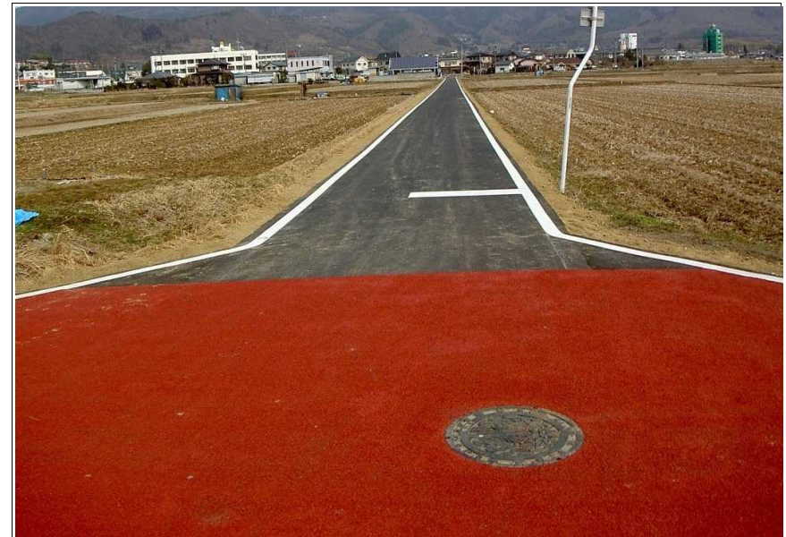
写真1-2 国見幹線(地内) 復旧状況