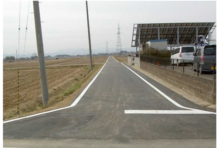
写真2-2 国見幹線(地内) 復旧状況