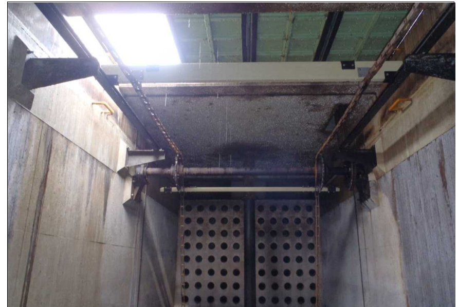
写真3-1 県北浄化センター(伊達郡国見町)汚泥掻寄機復旧状況