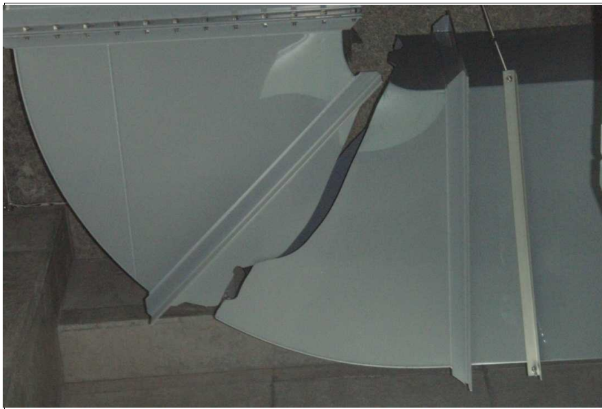
写真4-1 県北浄化センター(伊達郡国見町)ダクト損傷状況