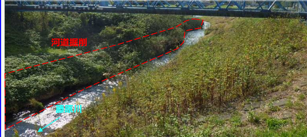
②藤原川 常磐下湯長谷町地内 【施工前】