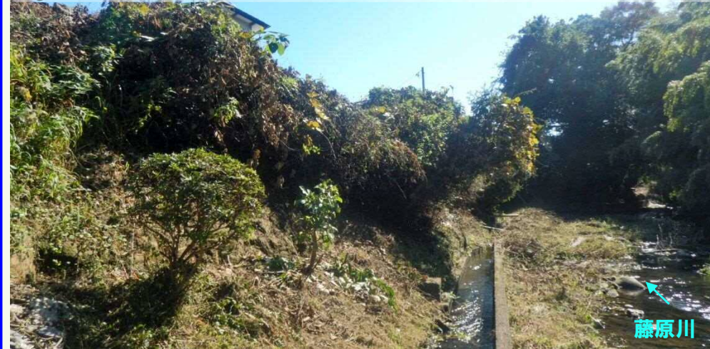
①藤原川 常磐藤原町別所地内 【施工前】