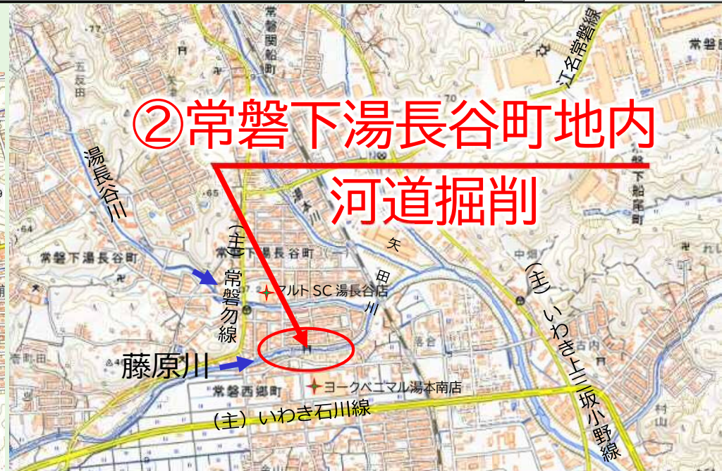
写真 藤原川で実施している工事の代表的な箇所を掲載しています。