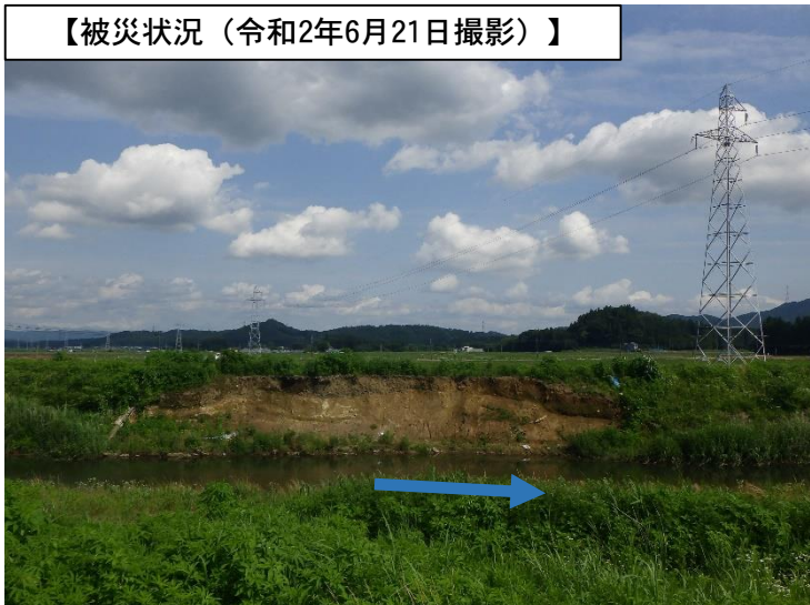
【被災状況（令和2年6月21日撮影）】