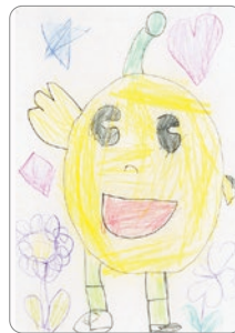
カラフルな いろ 色づかいがいいね☆