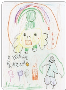
たの ちはら キビタンと楽しく なわとび中！