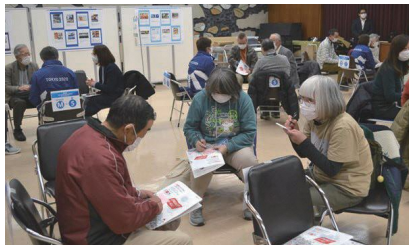
▲第3回 City Cast Fukushima ミートアップ！意見交換の様子