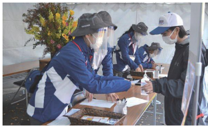
▲日本女子ソフトボールリーグ 決勝トーナメントでの子ども招待