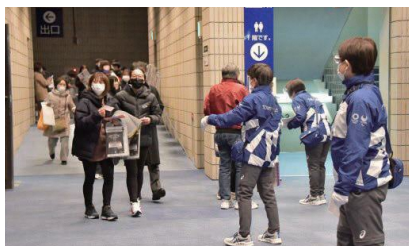
▲オリンピックコンサートでの観客誘導