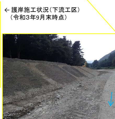
← 護岸施工状況(下流工区) (令和3年9月末時点)