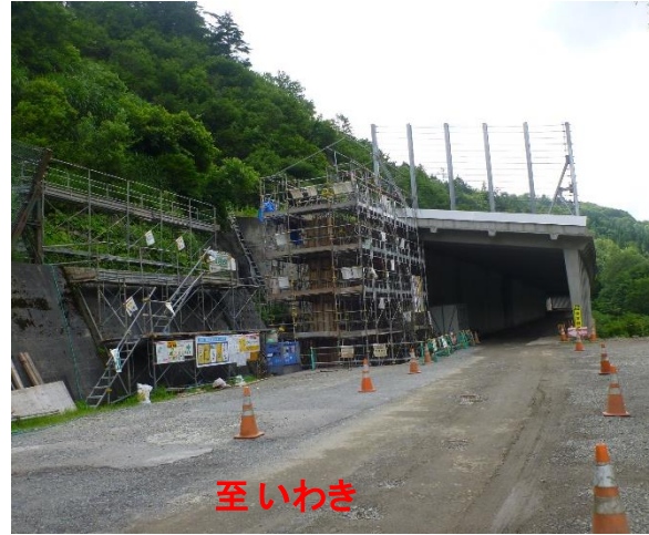
スノーシェッド工事状況