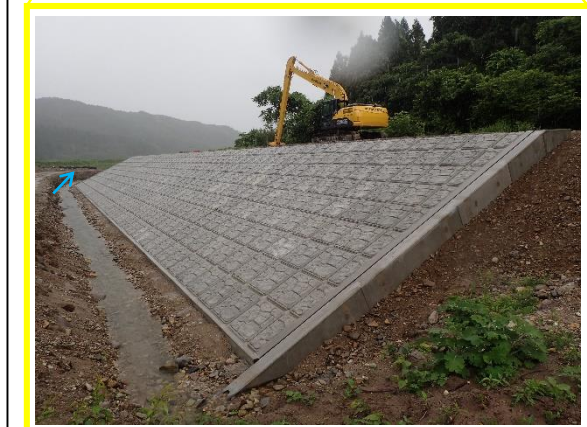
← 護岸施工状況 (令和3年6月末時点)