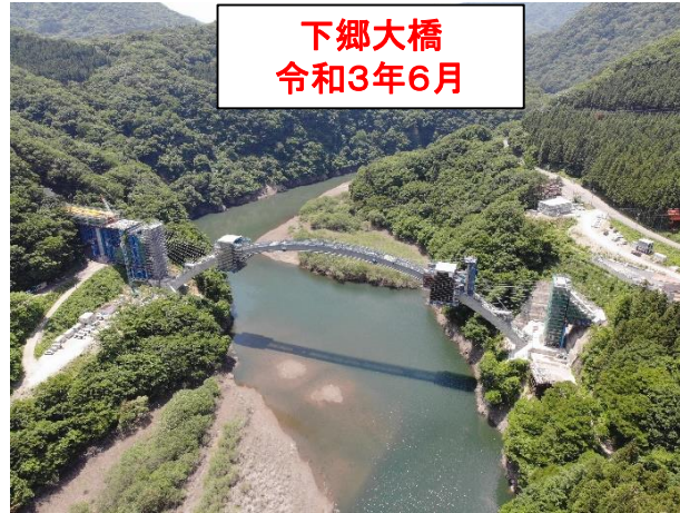
下郷大橋 令和3年6月