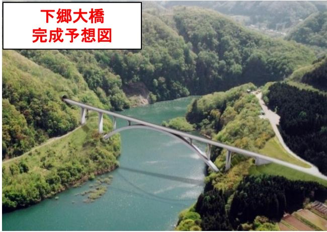
下郷大橋 完成予想図