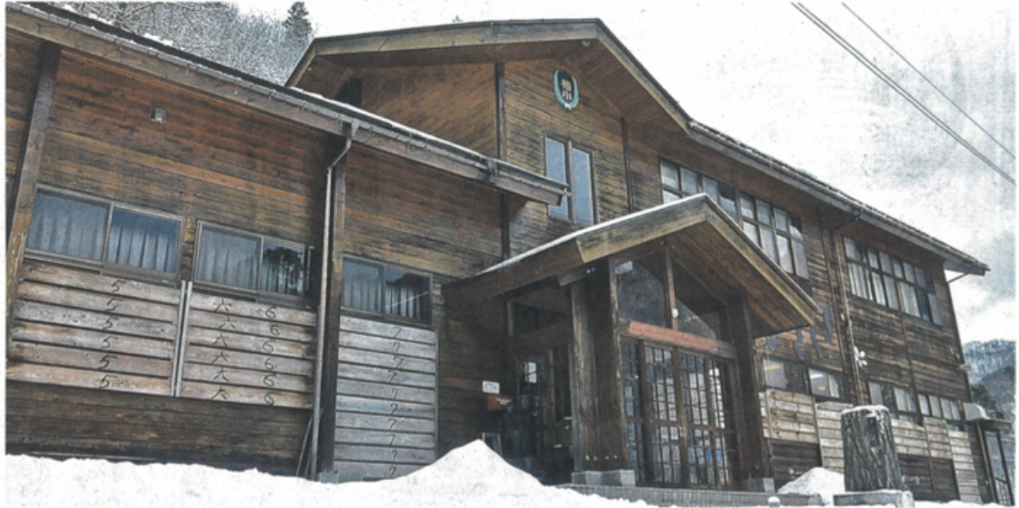
SDGsに関する体験学習などの拠点となる旧檜原小戸赤分校