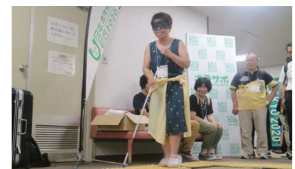
▼City Cast Fukushima ミートアップ!