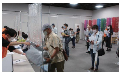
▲ユニフォーム受取