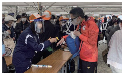
▲聖火リレーボランティア