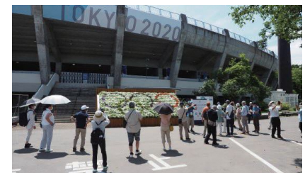
▼あづま球場見学会