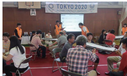
▲オリエンテーションでのアクティビティ