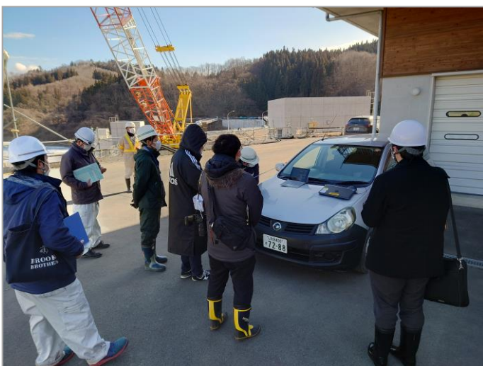
映像で模型実験紹介