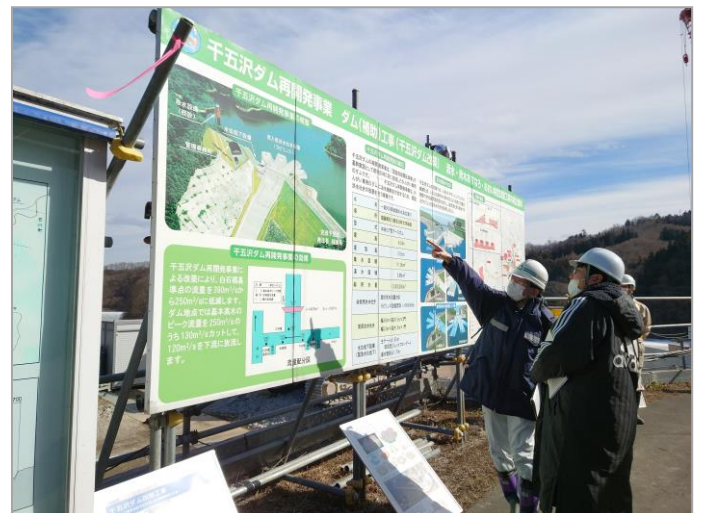
事業概要説明状況