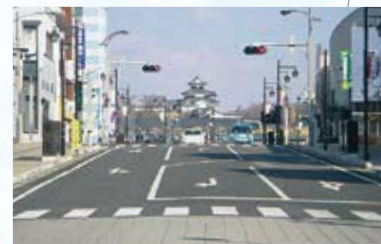
【道路】都市計画道路白河駅白坂線(白河市)