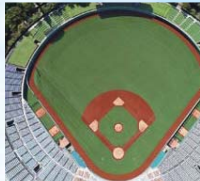
【都市公園】県営あづま球場(福島市)