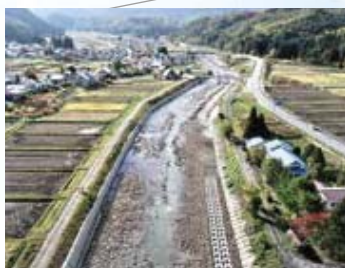
【河川】桧沢川(南会津町)