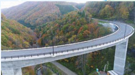
【道路】国道352号銀竜橋(南会津町)