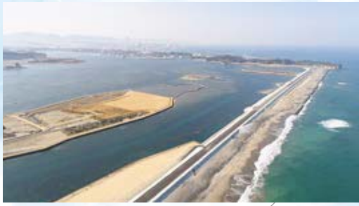
【海岸】大浜地区海岸(相馬市)