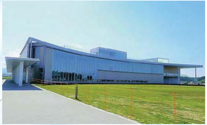
【建築】東日本大震災・原子力災害伝承館(双葉町)