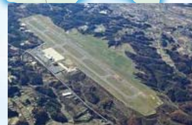
【空港】福島空港(須賀川市、玉川村)