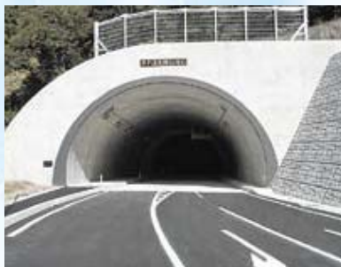
【道路】国道252号早戸温泉郷トンネル(三島町)