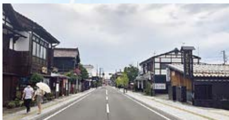
【道路】国道252号(会津若松市)