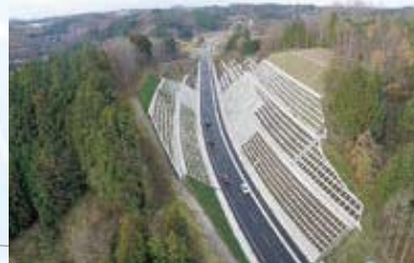
【道路】国道288号船引バイパス1工区(田村市)