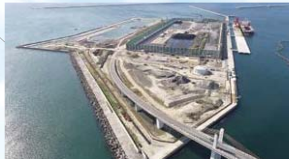
【港湾】小名浜港東港(いわき市)