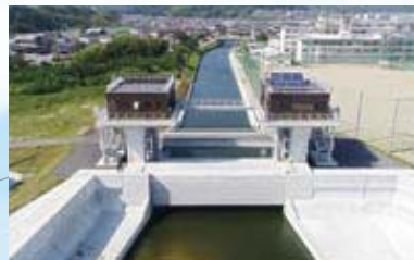
【河川】神白川水門(いわき市)