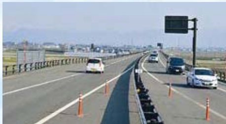
【道路】会津縦貫北道路(会津若松市～喜多方市)