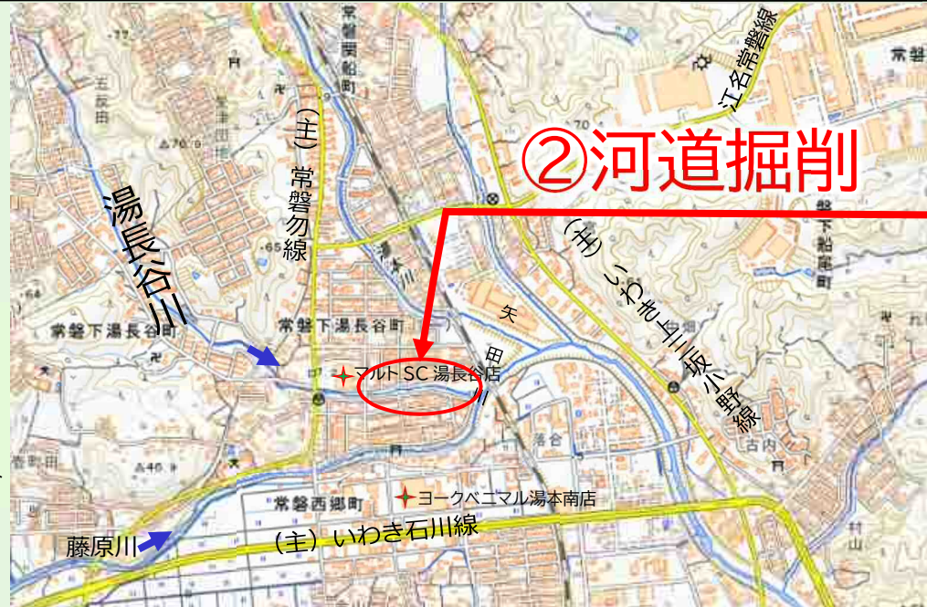
写真 現在、災害復旧工事等を実施している代表的な箇所を掲載しています。