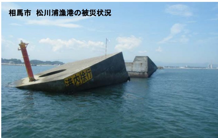
相馬市 松川浦漁港の被災状況