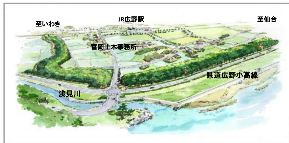
計画地南側より防災緑地を望む