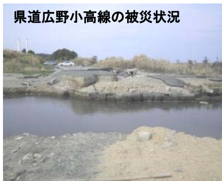
県道広野小高線の被災状況