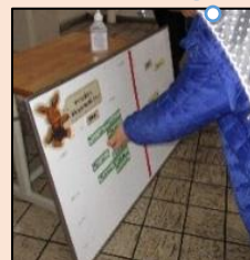
<お迎えの際、保護者がマグネットを外す>