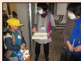
<マグネットを渡して子どもを引きとる>