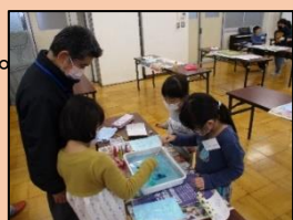
<どんな模様ができるかな?>

本日の活動は「マープリング」です。スタッフは、不思議な模様の出し方のコツを教えたり、うまくいかない子の手助けをしたりするなど、丁寧に接していました。子どもたちは、偶然にできあがる模様を目を輝かせながら夢中に取り組んでいました。