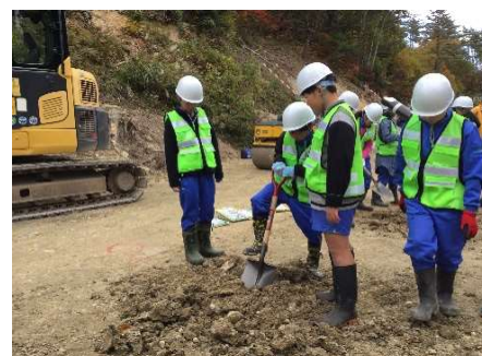
デリネータ設置作業体験