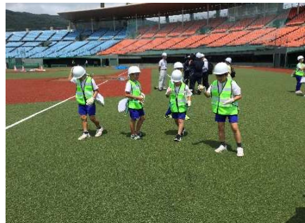
ゴムチップ撒き体験