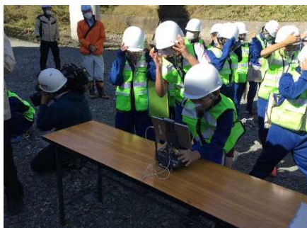
ドローン操縦体験