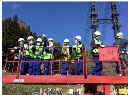
クレーン搭乗体験