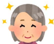
協働活動サポーターさん

子どもと関わることは楽しいです。若さや元気をもらっていると感ずります。町内で声を掛けてもらえることも嬉しいです。