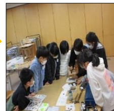
参加した子どもたち

最初は文字を打つことが難しいと思ったけれど、どんどん楽しくなりました。世界に一つだけのキーホルダーができて嬉しいです。