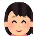
講師：協働活動支援員さん

子どもに真鍮のクラフトを教えるのは初めてでしたが、教わることも多かったです。楽しんでいる様子が見られてよかったです。