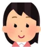
地域学校協働活動推進員さん

子ども同士、スタッフ同士、そして子どもとスタッフの関係性がとてもよく、温かな雰囲気の中で活動していました。「地域の人材が、地域の子も達を育て、見守る」意識が強く感じられました。