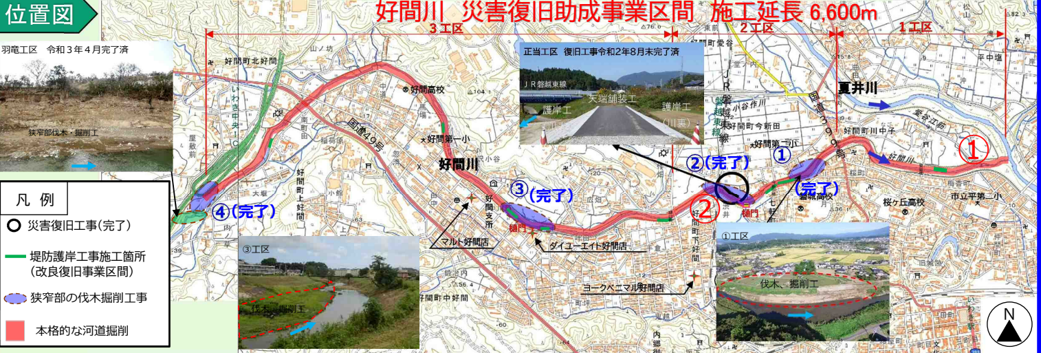
写真 好間川の改良復旧工事1, 2工区の掘削・護岸工を実施している箇所を掲載しています。

令和元年東日本台風の甚大な被害に対応するため、好間川では令和2年8月末に破堤箇所への復旧工事が完了し、「狭窄部の伐木掘削工事」(4箇所)に着工しており、令和3年9月末までに全箇所が完了しています。また、「本格的な掘削工事」についても事業区間を全3工区に分割して発注しております。