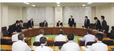
総務委員会の採決の様子

10月1、4、7日の3日間、6常任委員会が、それぞれ所管する部局等に係る議案の審査等を行った。このうち、農林水産委員会は1日に、土木委員会は4日にそれぞれ現地調査を行った。