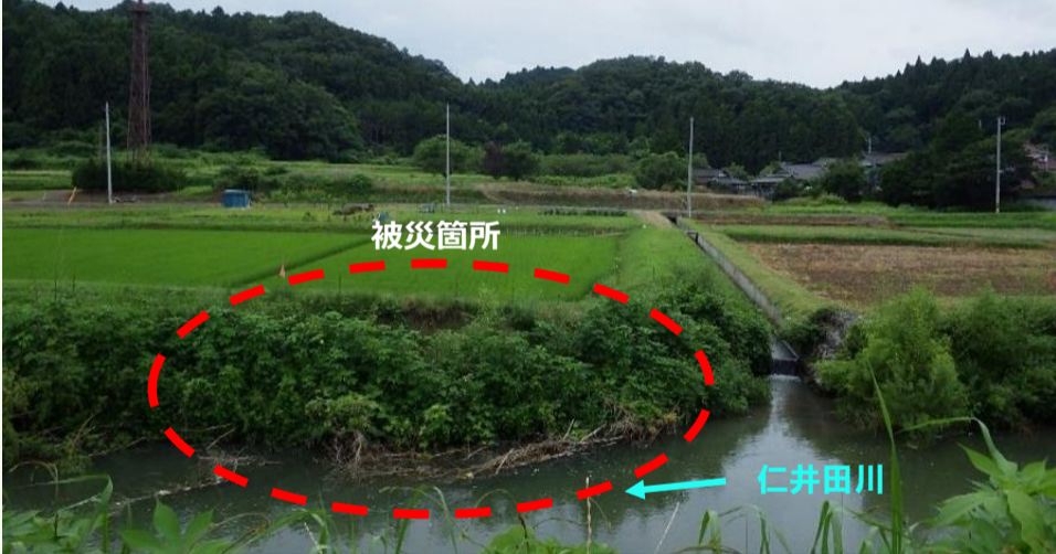
① 四倉町下柳生字熊ノ御嶽地内 【施工前】