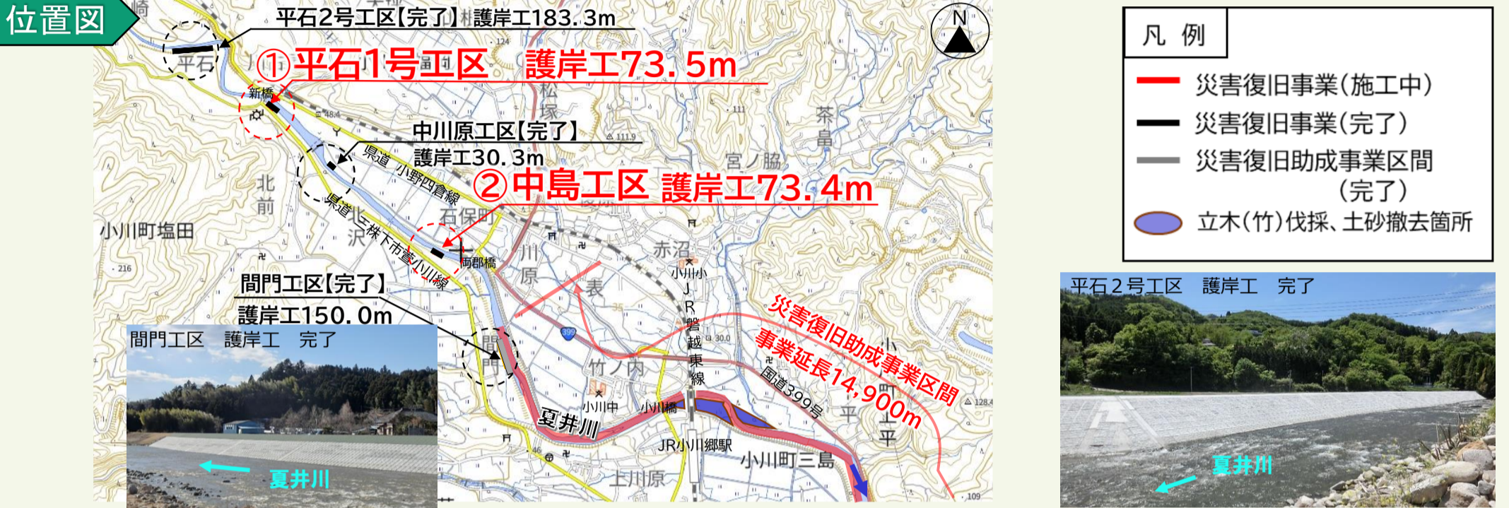
写真 現在、災害復旧工事を実施している代表的な箇所を掲載しています。