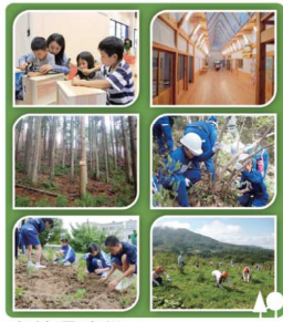
森林環境税で 森林を守り育てています