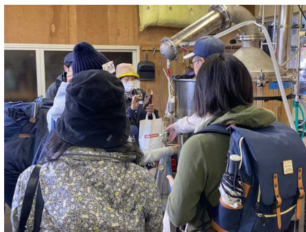
アロマの蒸留体験イベント