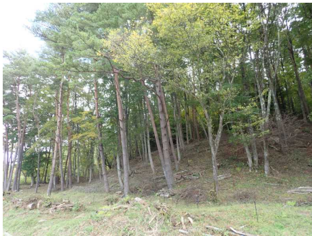
緩衝帯整備後の様子