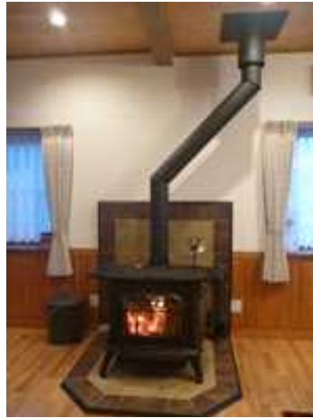
木質バイオマス利用ストーブ普及支援