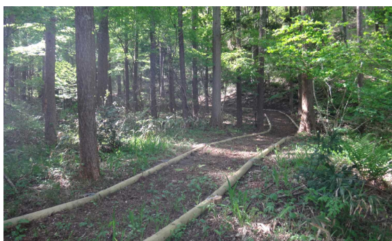
県有林における遊歩道の整備