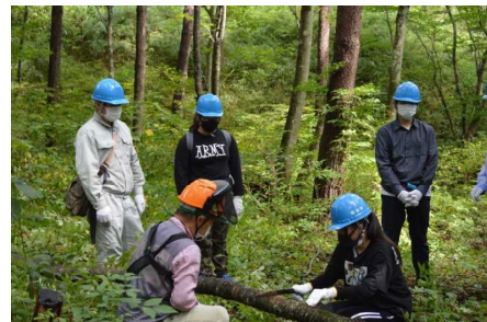
福島工業高校(定時制)・伐採作業の様子