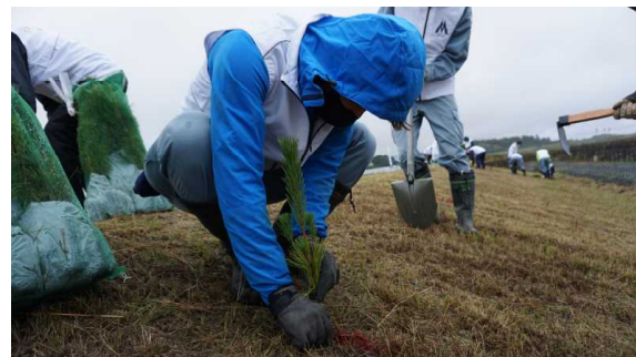
企業による森林づくり