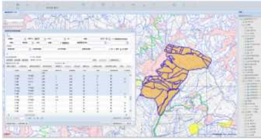
「森林クラウド」による森林資源情報の表示