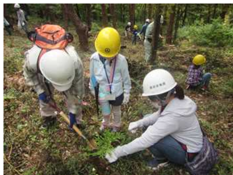
花粉症対策品種の苗木植栽