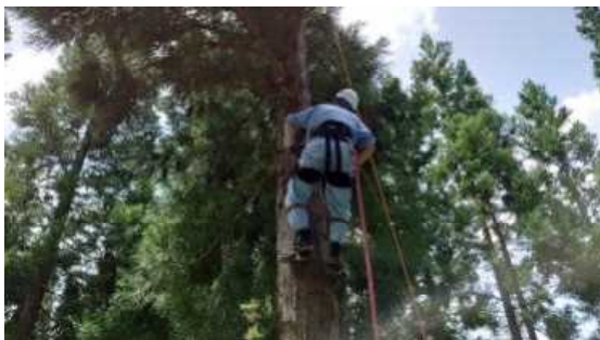
会津農林高校・演習林実習

林業関係企業見学や体験活動をとおして、地域の人々の生活や環境と森林との関係についてや森林・林業分野における先端技術を活用した取組について学習した。また、地域資源を用いた伝統工芸体験をとおして興味・関心を高めるとともに、森林の持つ多面的な機能や森林整備と木材利用の必要性などに対する理解と関心をさらに深めることができた。(遠野高校)