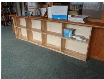
木製本棚の導入（北塩原村）