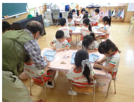
もりの案内人指導の木工体験