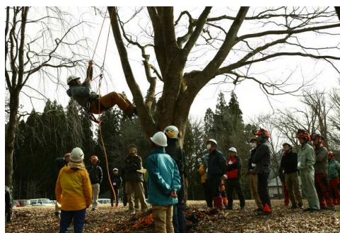
特殊伐採等技術伝承研修会