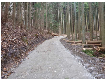
作業道の開設状況

水源区域及び水源かん養機能又は山地災害防止機能を重視する森林に対して、継続的な森林整備の促進を図るため、トラックが通行可能な耐久性のある作業道を開設する経費を助成した。