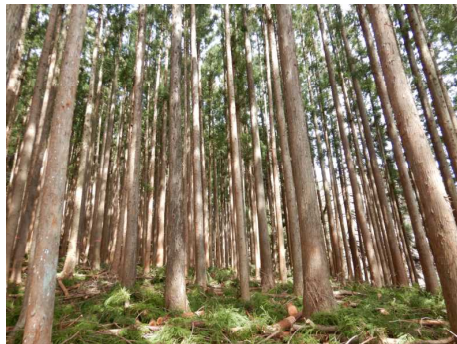
森林整備（間伐）実施後状況