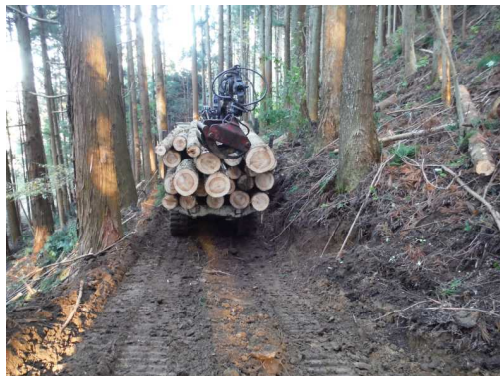
作業路を利用した間伐材の搬出

・林内作業路整備支援事業 500円/m いわき市ほか16市町村 53,613m (R元実績：49,500m) 【森林整備課】 間伐材の利用促進を図るため、間伐材の搬出に必要な作業路の整備を支援した。