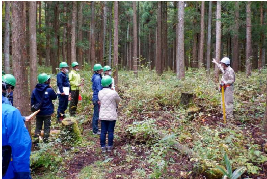
もりの案内人養成講座の様子