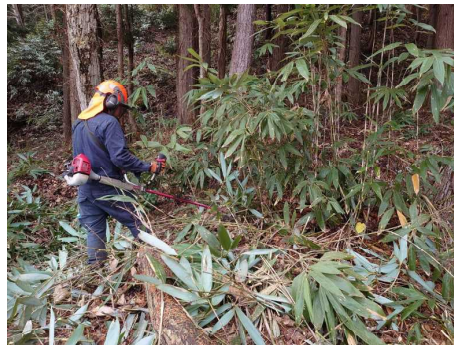
緩衝帯整備の様子