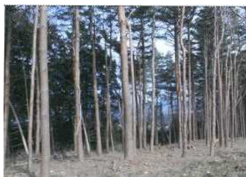
県民の森におけるフィールド整備（除伐）