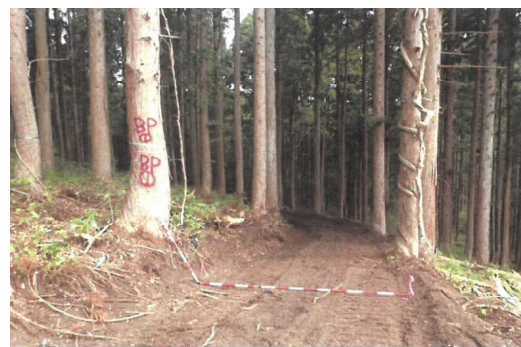
林内作業路の開設