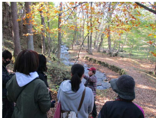
ふくしまの水に触れよう