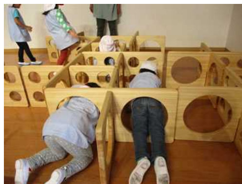
木製玩具モニタリング状況