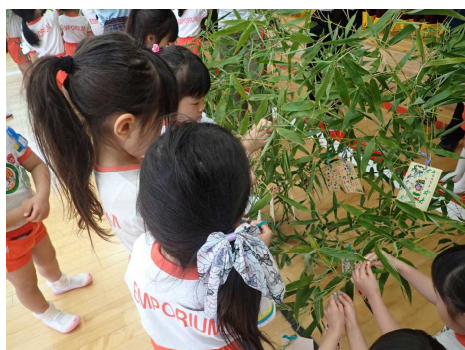
エコな願いの短冊を飾り付け