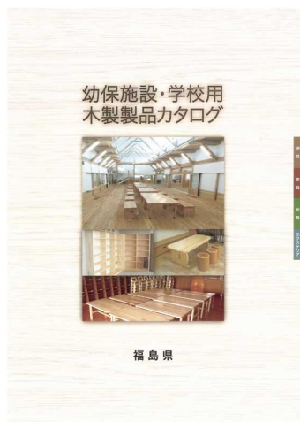
幼保施設・学校用木製製品カタログ

福島県の森林環境教育を支援するため、教育現場の意見や要望を調査し、その結果を踏まえた学習指導案及び教材・教具の制作に向けた方針の作成に取り組んだ。