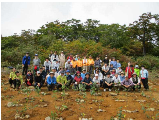
Save My Hometown