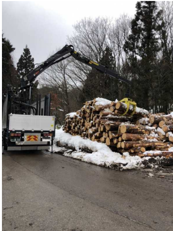
燃料用間伐材の搬出支援

補助実績：176棟（一般（子育て世帯除く）49棟、被災者等14棟、県外移住者2棟、子育て世帯111棟）森林認証材加算1棟 (R元実績：171棟（一般（子育て世帯除く）35棟、被災者等への補助は18棟、県外移住者1棟、子育て世帯117棟、森林認証材加算1棟）