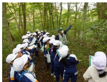
森林環境学習の推進（会津若松市）