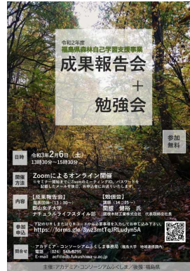
若者の森林自己学習支援事業 成果報告会