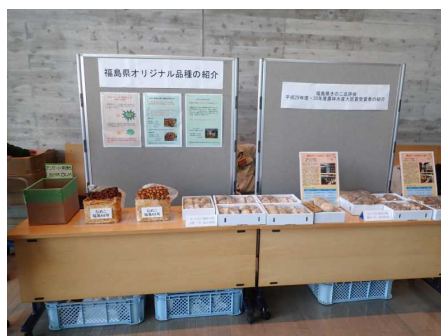
きのこ菌床等の展示