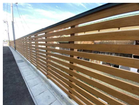
木塀の設置（矢吹町）