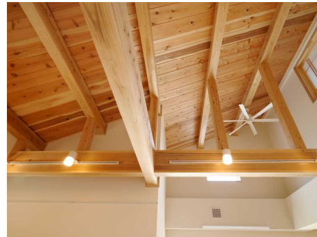
県産材を活用した住宅