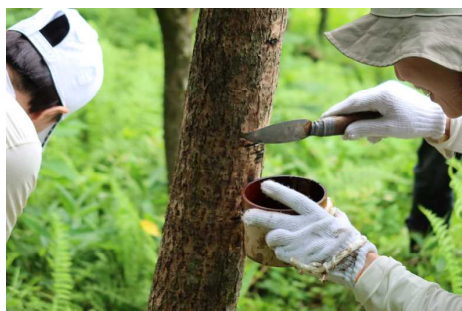
漆掻き職人育成研修