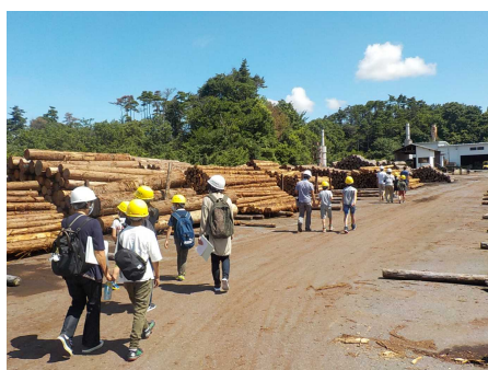
県民参画の推進（郡山市）