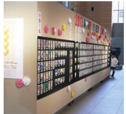
昨年度の展示風景