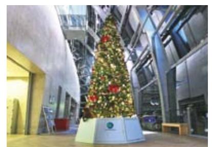
アクアマリンクリスマスツリー