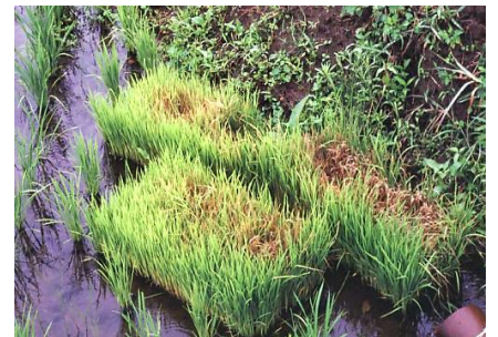
図2. 置き苗から発生したいもち

会津での葉いもちの初発は6月下旬です。移植時の箱処理剤や散布剤等で適切に防除しましょう。また、感染源となる補植用の置き苗は早急に処分しましょう(ひっくり返す、埋却する等)。