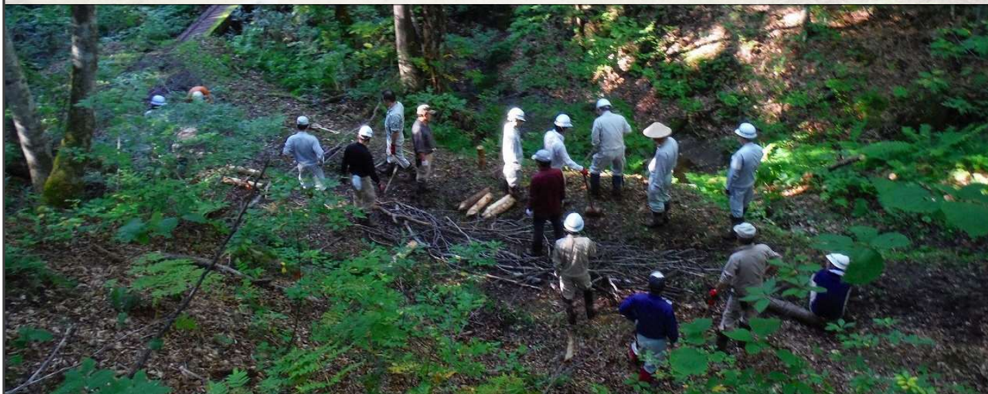
美女峠（餅ヶ沢工区） 道普請の様子（そだ柵工）

福島県では、車の通行が不能となっている県道別舟渡線(旧越後街道の束松峠)と県道会津若松三島線、県道小林会津宮下停車場線(銀山街道の銀山峠、美女峠、吉尾峠)を「歩く県道」として整備・利活用し、地域の活性化に繋げるための取り組みを行っています。今年度も道普請を実施して、街道の整備を行うとともに検討会を開催し、峠道を利活用した地域づくり活動について、地域の皆様と話し合いを行いました。