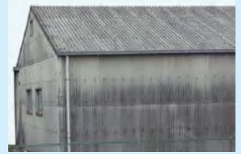
(石綿含有スレート)