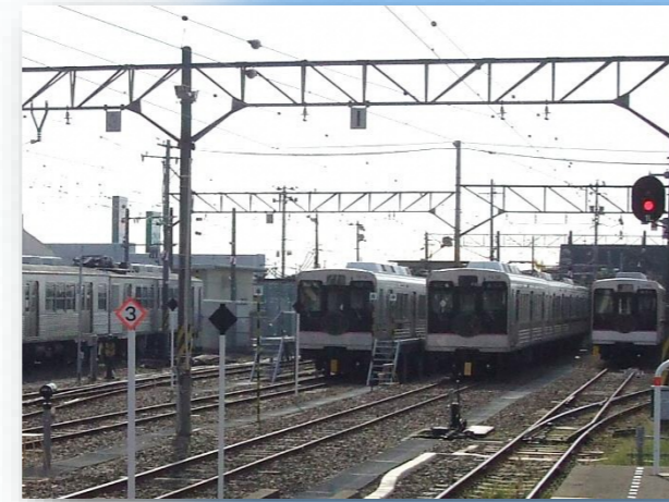
桜水駅 -想定される効果-

令和元年度 福島県省エネ対策推進事業補助金を活用して 飯坂線桜水駅・飯坂温泉駅を完全LED化 水銀灯・蛍光灯を更新