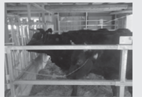
▲葛尾村で飼育されている牛たち

令和3年度より、水稲育苗施設、ライスセンター・農業用機械施設、和牛繁殖施設の3施設の整備工事が始まります。令和4年の春を完成予定とし、葛尾村の農業再開と生産基盤の充実・強化を図ります。葛尾村の特産物の復活が待ち遠しいです。