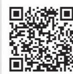
ADRセンターホームページ

問 原子力損害賠償紛争解決センター(ADRセンター) ☎0120-377-155(平日:午前10時～午後5時)