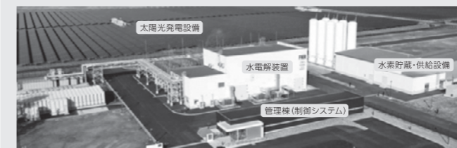
▲福島水素エネルギー研究フィールド概要

令和2年3月7日に開所したFH2Rは、再生可能エネルギーから水素を製造し、脱炭素化を実現する施設です。原子力や化石燃料に頼らず、町内の多様な資源をいかした事業を進め、地球温暖化防止に貢献します。浪江町では、スマートコミュニティ事業、水素を利用した事業など、新たな取り組みを積極的に進め「新しいチャレンジの町」として人が集うまちづくりを進めます。