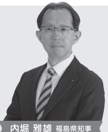
内堀 雅雄 福島県知事

県といたしましては、引き続き、皆さまお一人お一人のお気持ちに寄り添いながら、福島の新しい未来を形作るための挑戦を続け、復興・再生と地方創生が更に前進するよう、今後とも全力を尽くしてまいります。