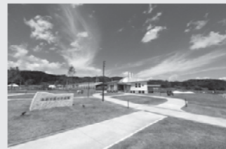
ふかや風の子広場▶

令和2年8月9日にどきどきワクワクがいっぱいつまった「ふかや風の子広場」が飯舘村道の駅「まてい館」近くにオープンしました。屋内運動施設には、子どもたちの想像力や冒険心がぐんぐんふくらむ遊具があります。今年、ドッグランが整備されますので、ぜひお越しください。