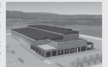
▲富岡町アーカイブ施設完成予想図(令和3年夏オープン予定)

富岡町の地域性を伝え、東日本大震災と原子力災害の風化防止、教訓の発信を目指す富岡町アーカイブ施設(仮称)は、令和3年夏の開館に向けて富岡町文化交流センター向かいで建設が進んでいます。常設展示室には地域の歴史資料や震災遺産が並び予定で、富岡町の魅力や複合災害の経験を町民目線で発信する施設として期待されます。