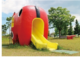
赤ベコの後ろから滑って登場! 大人でも十分入れる大きさです

会津地方の伝統工芸“赤ベコ”をテーマにした公園で、そこかしこに赤ベコのベンチや遊具があります。以前テレビ番組で赤ベコが紹介されたことで一躍脚光を浴び、話題となりました。赤ベコファンの中で密かに注目が集まっているスポットです。