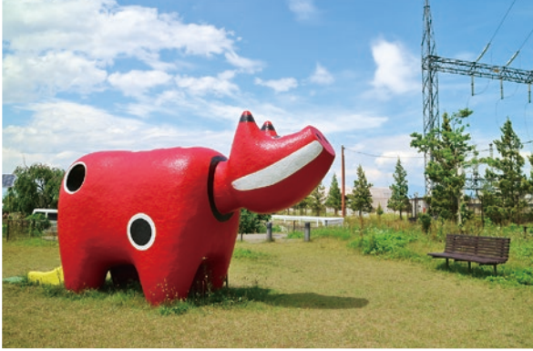
存在感抜群の巨大赤ベコ。その正体はすべり台!