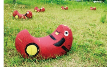
会津若松市神指町大字高久字北條163-12 園 会津若松市役所 まちづくり整備課 ☎0242(39)1275