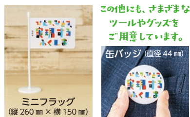
※実物と多少異なる場合があります。

広報隊として活動いただける方にはポスターやミニフラッグ、缶バッ ジなどを無償でお送りしますので、掲出や着用をお願いします。