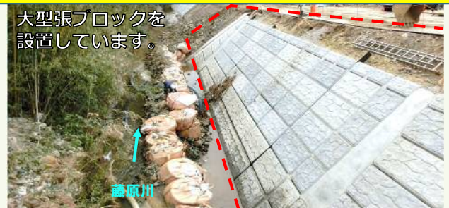
大型張ブロックを設置しています。

その他の災害の復旧状況についても、いわき建設事務所ホームページに掲載しております。 Q「いわき建設」で検索 もしくは、右の QR コードから閲覧できます。