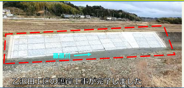
乙沢田工区の護岸工事が完了しました