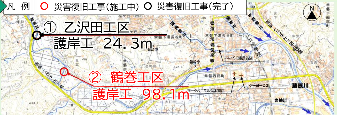
写真 現在、災害復旧工事を実施している代表的な箇所を掲載しています。