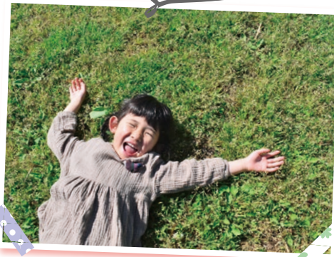
会津総合運動公園でゴロン 気持ちよさそう！