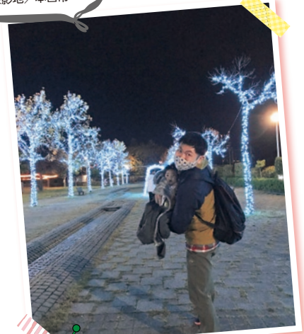
みずいる公園でツーショット イルミネーションがきれい！