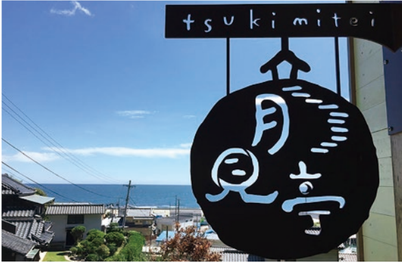
店先の看板にはさりげなく三日月が描かれている