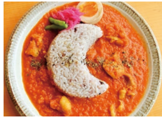
季節ごとにカレーのルーの種類が変わる(写真はバターチキンカレー)

NPO法人の手により空き家から生まれ変わったカフェ。東日本大震災後、中之作の古き良き港町の風景を保存するため、いわき市住民も修復作業に参加しました。メニューには、採れたての野菜を使った料理や、福島県産のフルーツを味わえるデザートもあります。