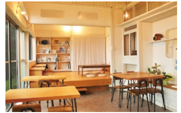
いわき市折戸折戸 36-3 ☎050-1099-0262 定休日/水曜・木曜 営業時間/午前11時~午後5時 (ラストオーダー午後4時30分)