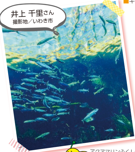
アクアマリンふくしま キラキラで幻想的だね！