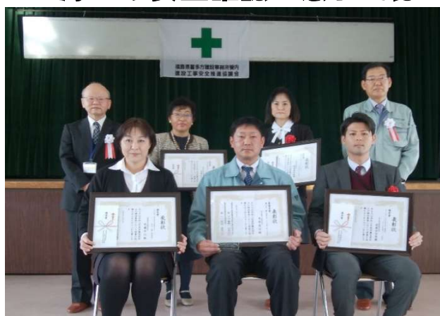
受賞者の皆様、おめでとうございます (^^)v

喜多方建設事務所の安全協議会HPに標語シートを掲載しますので、シール用紙等に印刷してご利用下さい。