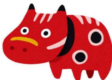
令和2年度 労働災害防止標語

最優秀賞の作品は、来年度の喜多方建設事務所の「 建設工事安全対策重点計画書 」スローガンに採用します!