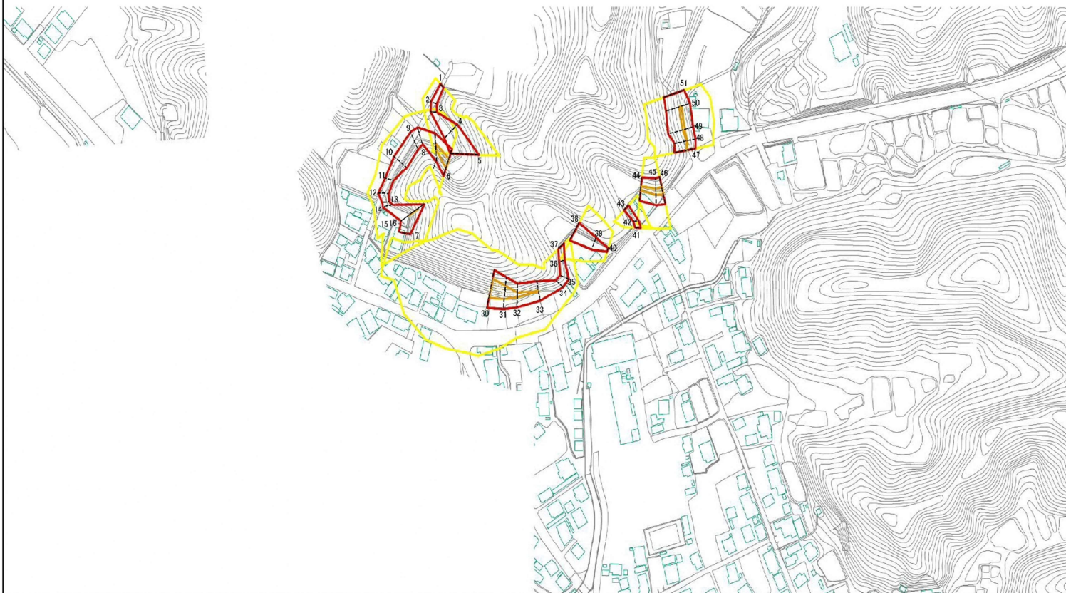
図中の数字は横断測線番号を示す