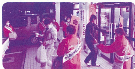
【西会津町交通安全母の会】 R 2.10.15 リオンドール野沢店