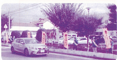
【南相馬市交通安全母の会】 R 2.10.15 小高区役所前