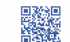
渡る際には意思表示編