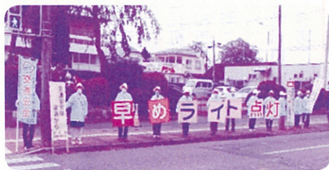
【鏡石町交通安全母の会】 R 2.10.16 鏡石町役場前交差点