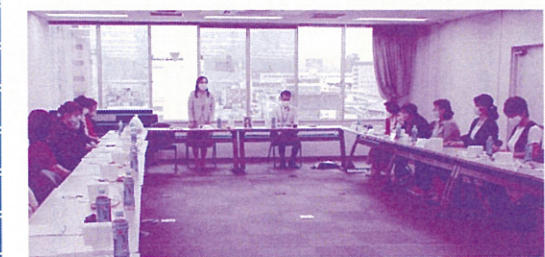
実行委員会の様子

ジにおいて、北海道・東北ブロック講習会と併せての開催でした。あれから二十年が経ちます。 また、まもなく十年となる東日本大震災及び原発事故により、母の会活動もままならず、まだ故郷に帰れない、又は帰らないと決めて他所で辛い心を持ち続け生活されている人たちもいらつしやいます。このうつくしい福島で生きている幸せを感じつつ五十周年を迎えましょう。 会員の皆様にはご協力をどうぞよろしくお願ひ申し上げます。新型コロナウイルスの早い終息を願ひつつ。