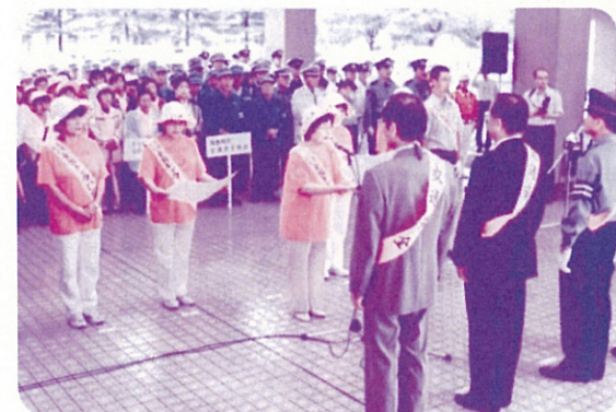
交通安全キャラバンの様子