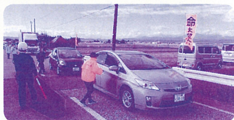
【会津若松市交通安全母の会】 R 2.10.15 主要地方道会津坂下・河東線