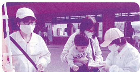
【国見町交通安全母の会】 R 2.10.15 道の駅国見あつかしの郷