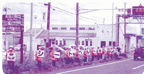
【西郷村交通安全母の会】 R 2.10.15 国道4号西松屋前