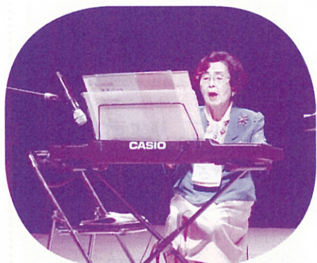
母親大会で「県交母の歌」の歌唱指導をする名誉会長