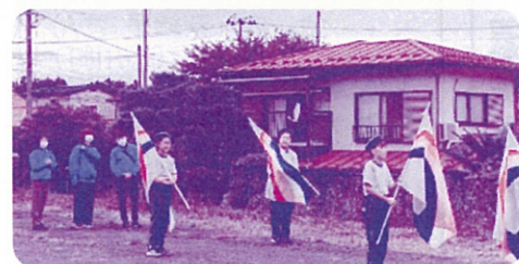
【白河市交通安全母の会】 R 2.10.19 表郷小学校鼓笛パレード