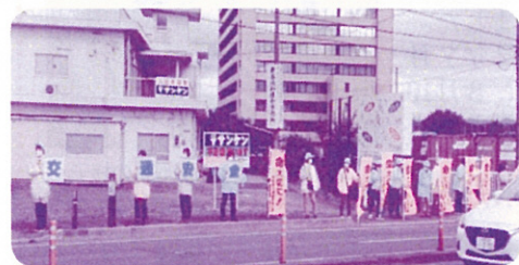
【福島市交通安全母の会】 R 2.10.15 国道13号福島北警察署入口交差点

県内各市町村交母会では、県交母事業の他に、高齢者や幼児、ドライバーに対し積極的に交通安全啓発活動を実施しております。本年度は新型コロナウイルスの影響で人との接触を避けるため、大規模な啓発活動やキャンペーンといった事業が中止される中、各市町村の交母会においては、感染拡大防止対策に留意しながら啓発活動を実施いたしました。私たちは「交通安全は家庭から」をスローガンに悲惨な交通事故を一件でも無くすため、母親の目線から家庭や地域に根ざした活動をこれからも継続していきます。