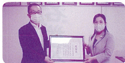
福島県自動車会議所様への感謝状贈呈