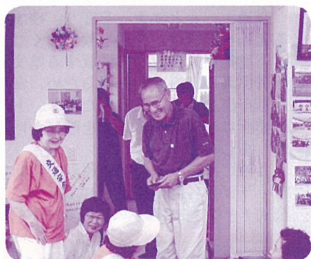
仮設住宅を訪問する名誉会長