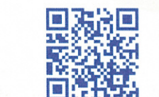
誰も止まってくれない編