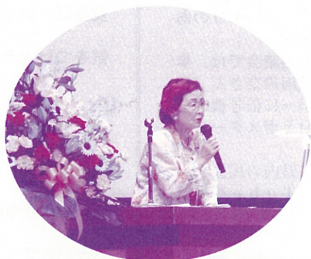
母親大会で講演する名誉会長