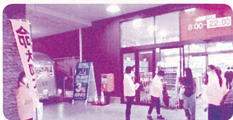
【大玉村交通安全母の会】 R 2.10.14 PLANT5大玉店