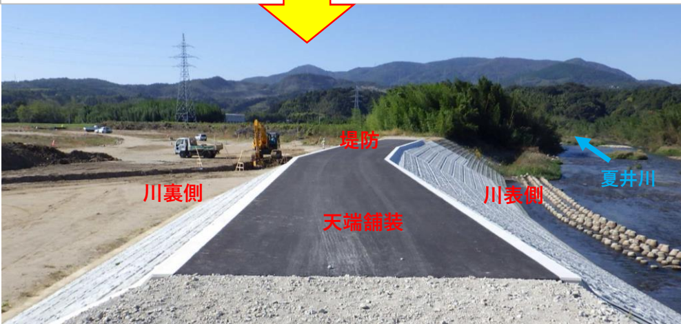
天端舗装完了 (9月末)