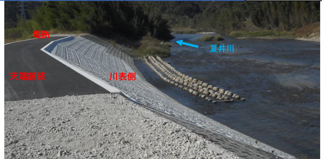
川表側 コンクリート張ブロック完了 (5月末)