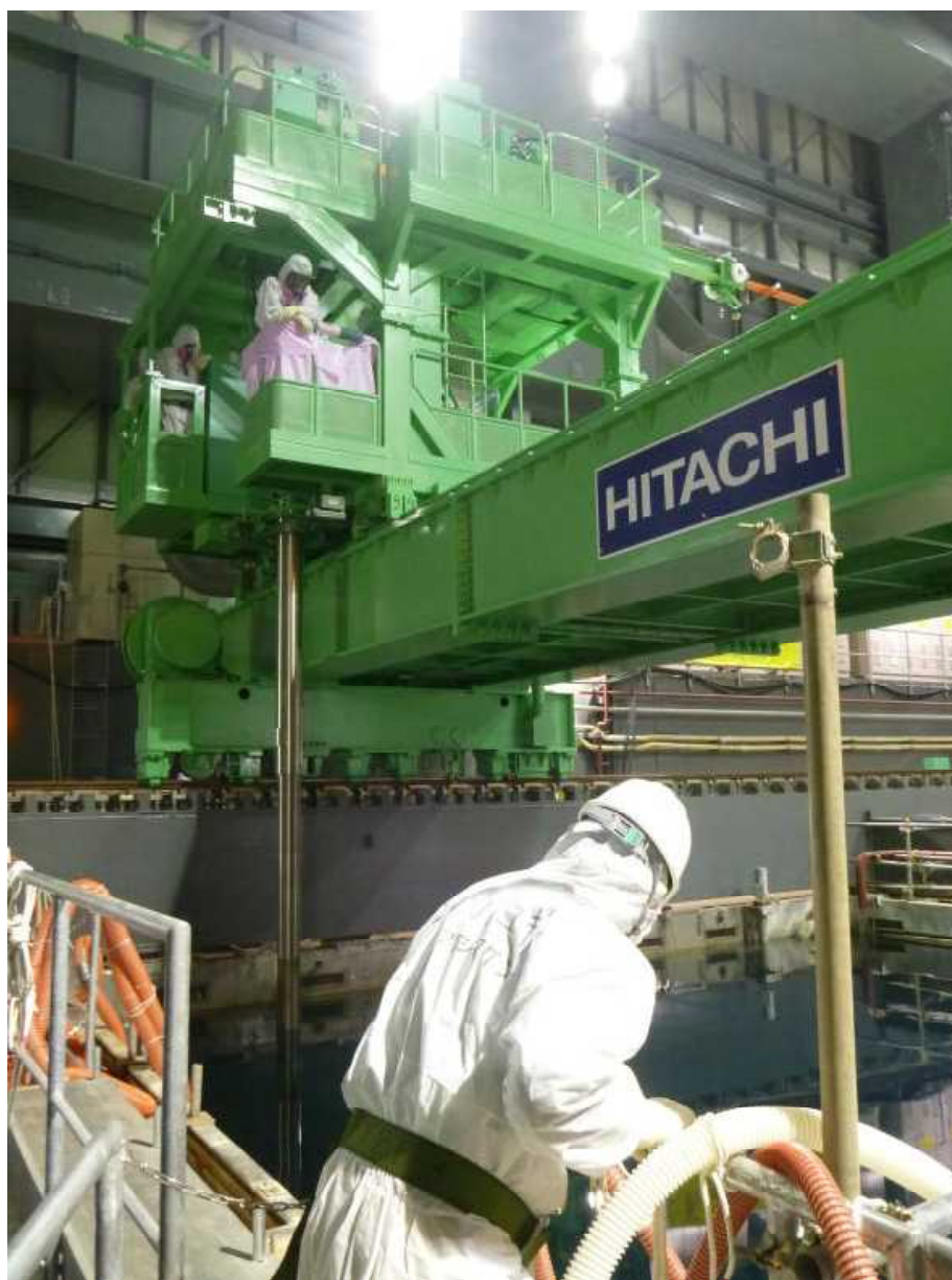
1 使用済燃料プールからの燃料の移動作業の状況