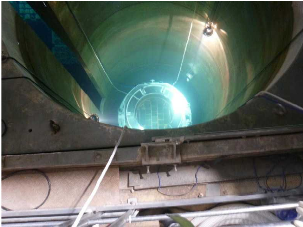
2 キャスクピットの状態