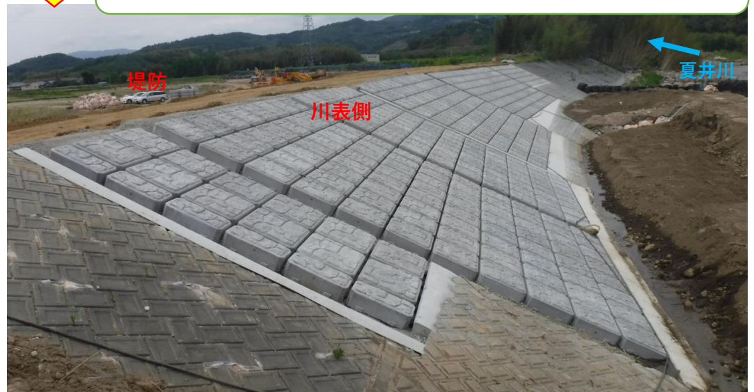
川表側 コンクリート張ブロック完了

川表側破堤部の護岸が、5月末に完了しました。引き続き、川裏側の護岸と天端舗装工について整備していきます。