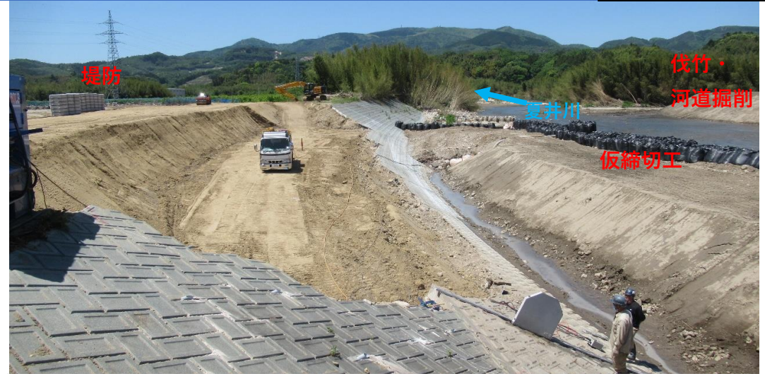
川表側 堤防盛土施工中