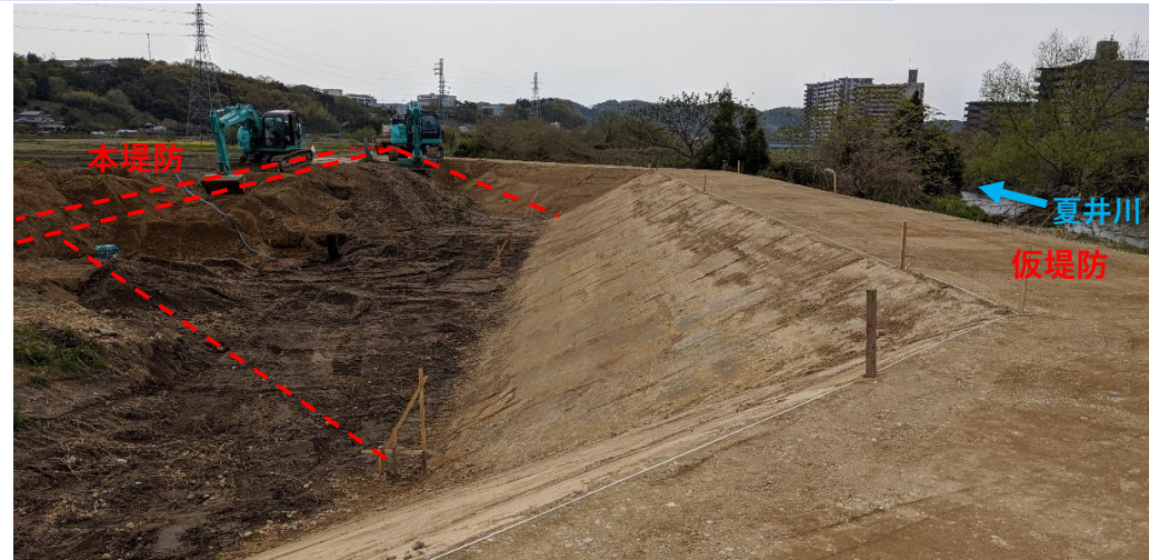
仮堤防設置完了、堤防盛土施工中