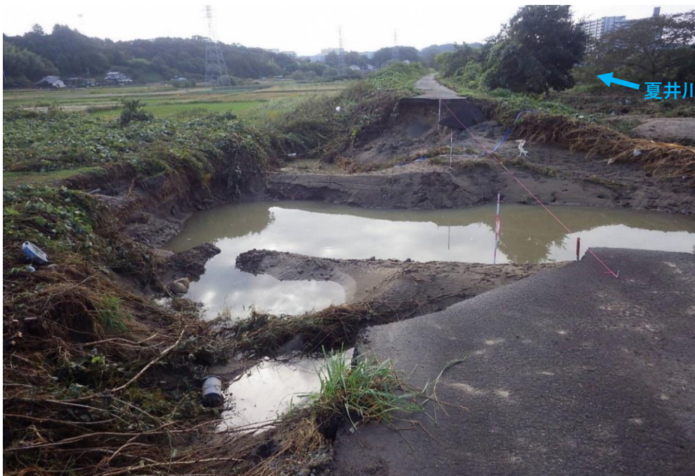
被災状況 (令和元年10月13日撮影)