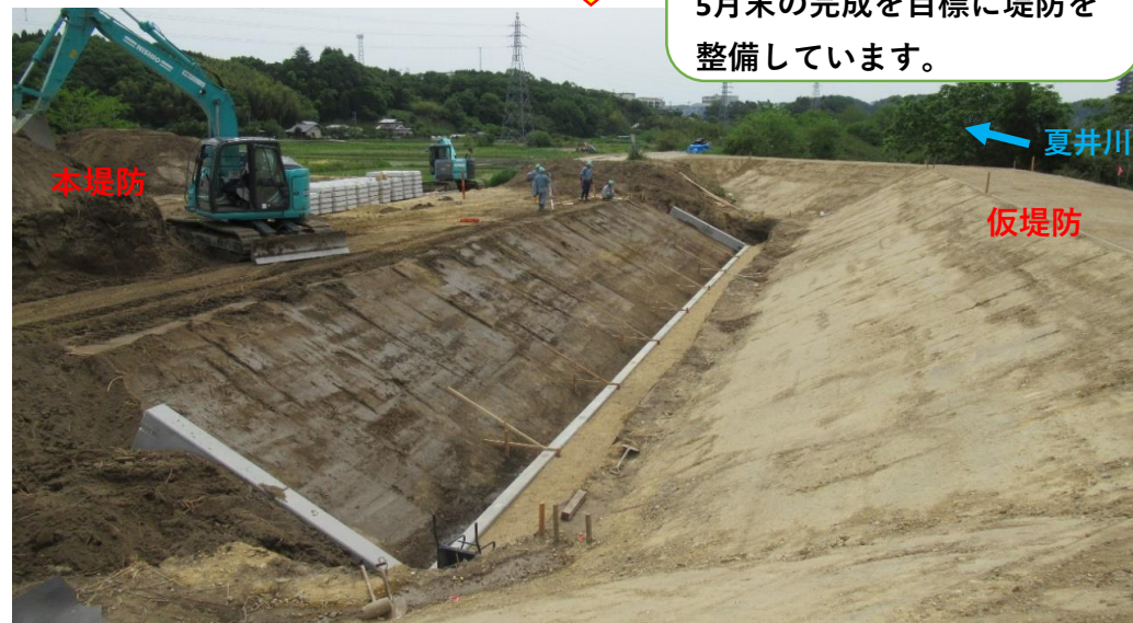
堤防盛土、小口止完了 張ブロック着手

堤防本体を復旧する前に堤防前面に仮堤防を設置しました。5月末の完成を目標に堤防を整備しています。