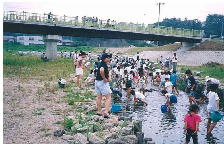
前田川 親水、環境に配慮した整備(双葉町)－河川整備