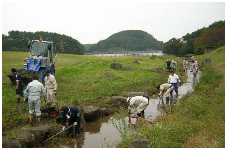
地域住民による藤沼ため池流入水路の整備活動(須賀川市)－県基金