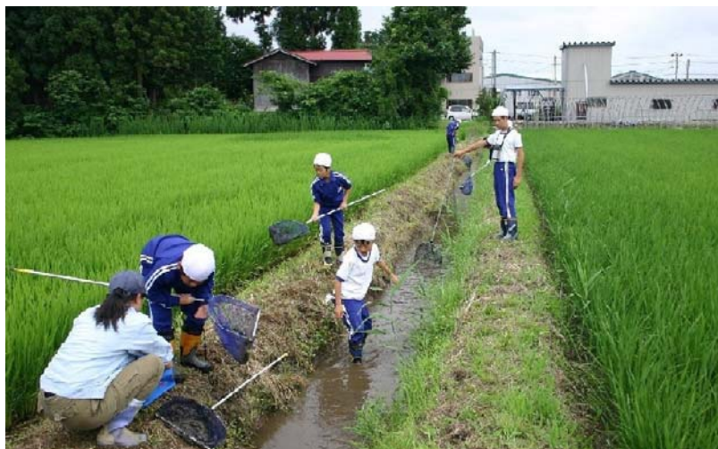
たんぼの生き物調査 塩川小学校(塩川町)