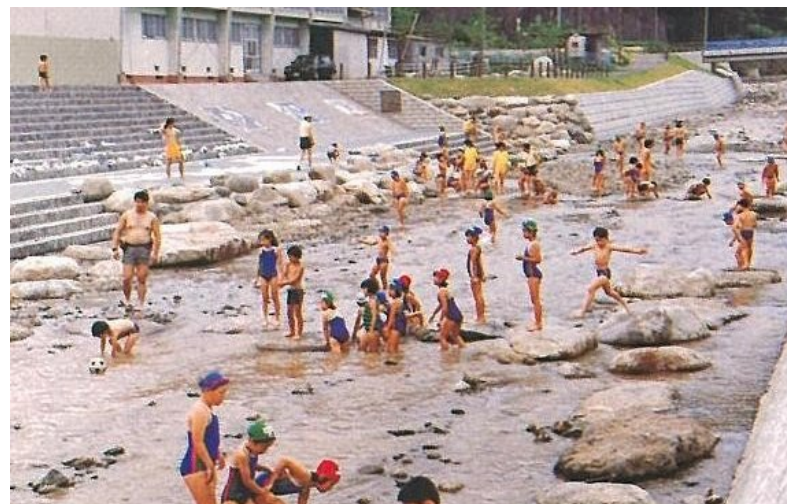
石田川 石田小学校 (霊山町)－災害復旧