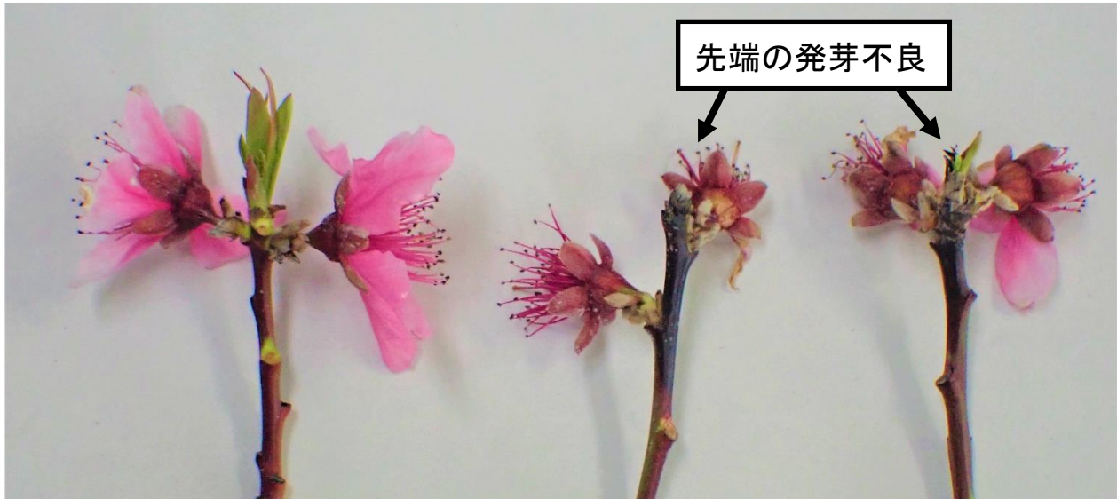
図1 枝先に発生した春型枝病斑（左：健全な枝 中央、右：発病枝）