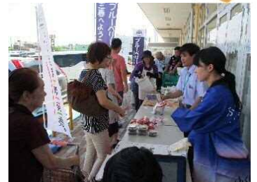
（キャンペーンイメージ）